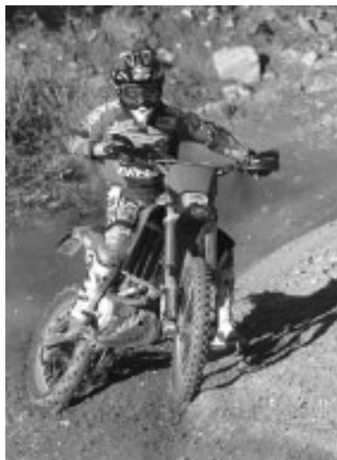
De RXV in actie