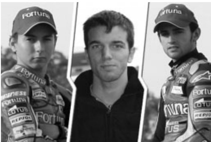
Jorge Lorenzo, Alex de Angelis en Héctor Barberá, de drie Aprilia-azen