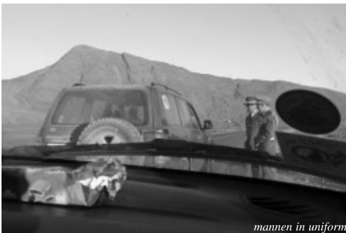
mannen in uniform

Dit is een keerpunt in onze trip; we waren van plan om naar Tan Tan te gaan, dat is de laatste bivak plaats in Marokko, ver in het zuiden en weer bijna aan de kust. Dat is leuk als we grotendeels dezelfde route kunnen volgen en dus veel deelnemers zien. Morgenochtend steekt de rally in colonne de grens over naar Mauritanië en daar houdt het voor ons op.