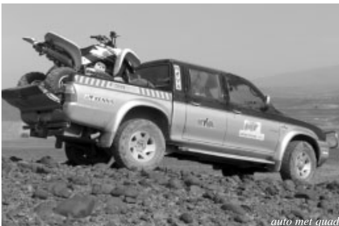
auto met quad

Dan nog voor onszelf de nodige zaken als kleding, tenten, slaapzakken en natuurlijk een behoorlijke voorraad eten en drinken. Kleine zaken als kaarten, communicatieapparatuur, gps navigatie en laders voor camera en telefoon e.d.vinden een geïmproviserde plaats voorin, wat gepaard gaat met nogal wat snoeren.