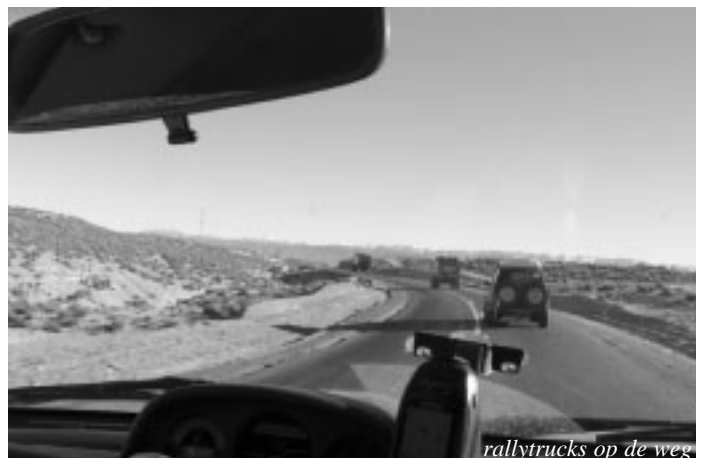
rallytrucks op de weg

We zoeken een route om die te doorkruisen. Al gauw blijkt dat diezelfde route ook gebruikt wordt door voertuigen die de rally ondersteunen. Dat zijn geen deelnemers, maar wagens die de benodigdheden voor het bivak, zoals tenten, voorraden, onderdelen en monteurs vervoeren. We komen meerdere trucks tegen die onderweg zijn naar het volgende bivak. Omdat we zelf niet de precieze route van de rallydeelnemers weten besluiten we deze trucks te volgen zodat we zeker weten dat we bij de rally zullen komen.