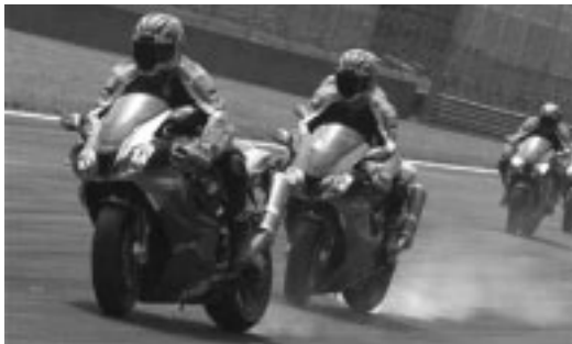
Milles in actie