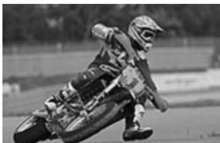
De SXV in actie

En we hebben natuurlijk de prachtige off road modellen, de SXV en de RXV.”