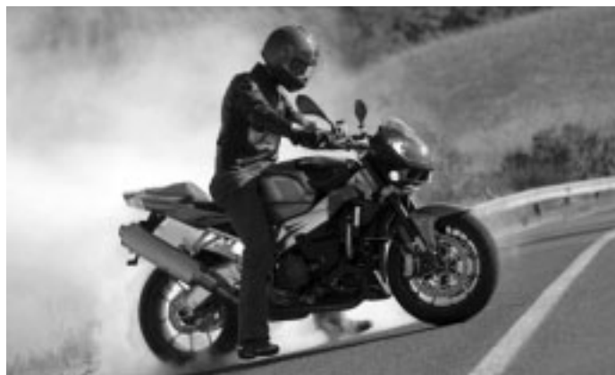
De Tuono in actie

“We hebben eerst onze handen vol aan het optuigen van Moto Tricolore. Dat moet eerst goed lopen. Daarna gaan we verdere plannen maken. Je kunt ons overigens wel vinden op de Motorbeurs in Utrecht! En aan het eind van het jaar de RAI nieuwsshow.”