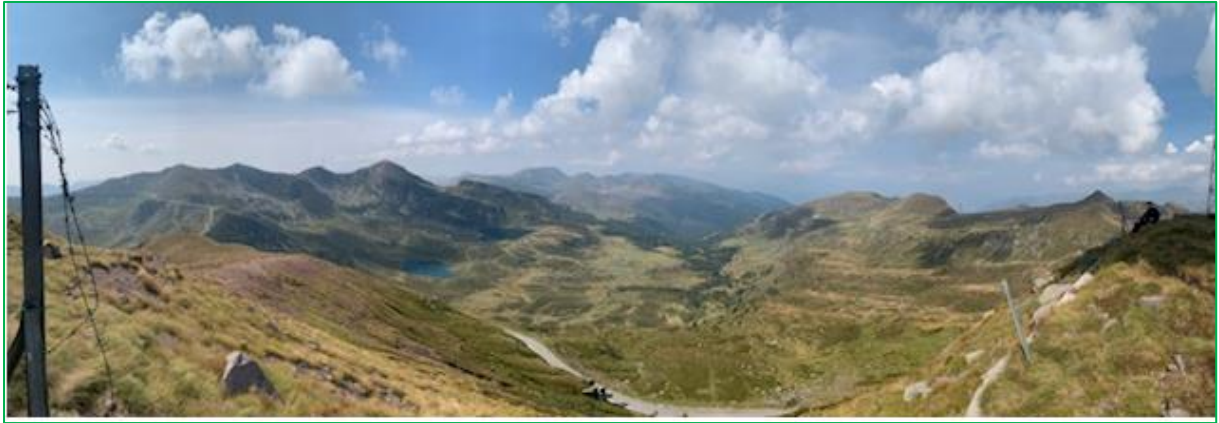
Fenomenaal uitzicht vanaf de Col di Crocette