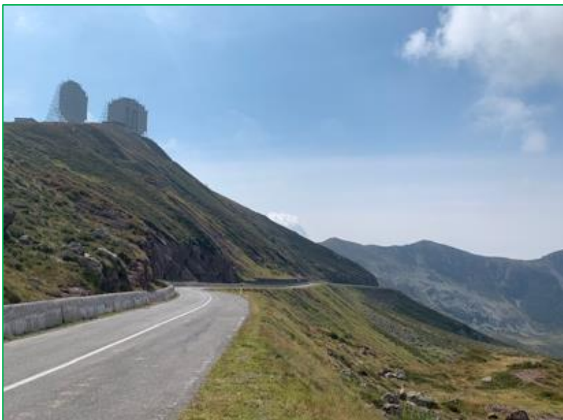
Nato uitluisterstation bovenop de Col di Crocette

Vanaf maandag verschillende routes gereden, wisselend van 380 tot 260 km op een dag. Met als hoogtepunten de Gavia en het oude Nato uitluisterstation op de Col di Crocette ( SP 345 ).